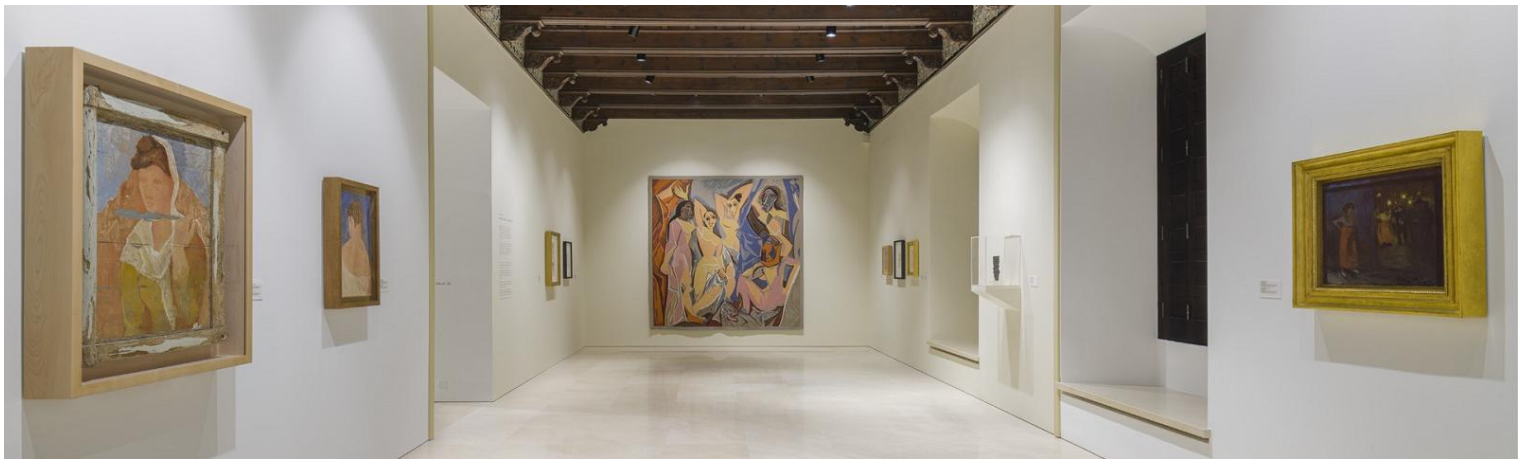
【 畢卡索美術館(Picasso Museum) 】

★ 畢卡索美術館(Picasso Museum) ：完整展出畢卡索作品的第一間美術館，畢卡索生前作品眾多，館內收藏展出了藝術家早期學院派作品及後期的前衛作品，參觀館內作品就像遊歷了畢卡索的一生，親身走進藝術史更了解這位世界知名藝術家，來到畢卡索博物館，除了欣賞藝術大師不同時期的鉅作外，博物館內的精緻宮殿式建築也是不可忽略的重點，一定不能錯過！