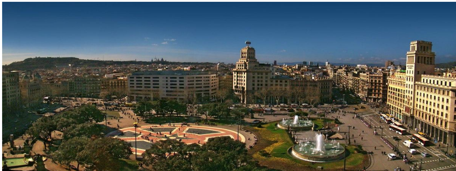
【加泰隆尼亞廣場(Plaça de Catalunya)】

● 加泰隆尼亞廣場(Plaça de Catalunya) ：為巴塞隆納的心臟地帶，連接著舊城區及新城區，主要幹道都匯集於此，許多表演及示威遊行都會在此地進行，是個與巴塞隆納居民生活息息相關的場地，廣場上有著許多雕像、噴泉，也有眾多的鴿子聚集，餵食的盛況十分壯觀！