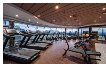
【MSC 地中海郵輪 船上設施】