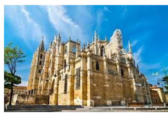
【西班牙·瓜達拉哈拉】