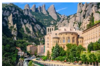
【西班牙·蒙塞拉特山】