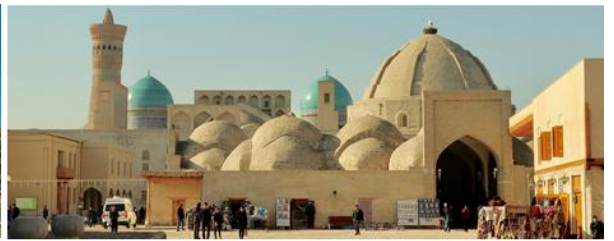
塔克圖頂市集 Trading Domes