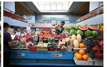
綠色市集 Green Bazaar

【樂器博物館 Museum of Kazakh Musical Instruments】一座類似北歐建築的博物館，位於 Panfilov Park，展示哈薩克的民族樂器。