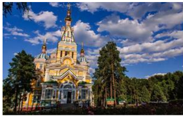
東正教升天大教堂 Zerkov Cathedral