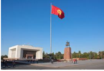
阿拉土廣場 Central Square Ala-Too

【中央清真寺 The central Mosque】於 2018 年開放，以其宏偉壯麗令人印象深刻。它是中亞最大的清真寺。清真寺採用奧斯曼時期的建築風格建造，與安卡拉科賈特佩區的清真寺相似。