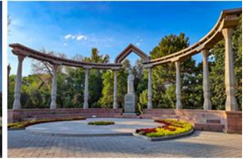
橡樹公園 Oak Park