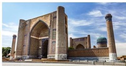
比比哈妮姆清真寺 Bibi Khanum Mosque