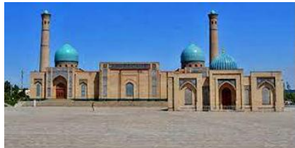
伊瑪目宗教建築群 Khazrati

晚餐後專車前往機場，準備回到台灣溫暖的家。揮揮衣袖，告別這個由陌生變熟悉的國度，收拾起美麗的回憶，又為人生相簿多添色彩。