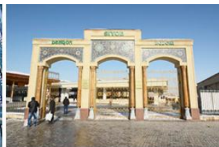
傳統市集 Siab Bazaar