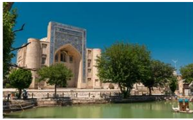
利亞比亞茲廣場 Lyabi-Hauz square