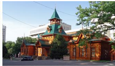
民族樂器博物館 Museum of Kazakh Musical Instruments