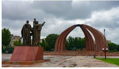
勝利廣場 Victory Square