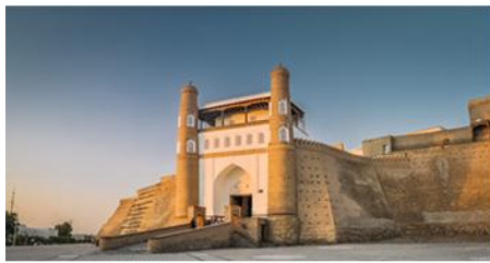
亞克城堡博物館 ARK FORTRESS