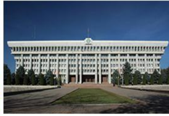
白宮 White House