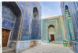
永生之王陵墓群 Complex Shakh-i-Zinda