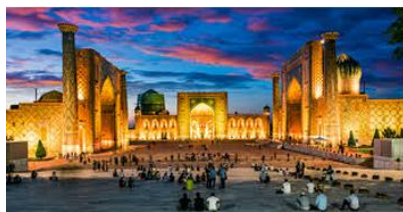
雷吉斯坦廣場 Reghistan Square

【永生之王陵墓群 Complex Shakh-i-Zinda】沙赫靜達意思是「永生之王」，它是 14 至 15 世紀中亞最著名的朝聖地，埋藏了帖木兒親人的 11 個陵墓。相傳 8 世紀初，伊斯蘭教創始人堂弟來到這裡傳教，被殺害後伊斯蘭教成為當地國教，遇難地被定為聖地。後來，執政者將自己和家族成員的墳墓也建在此地，形成一個廣闊建築群。