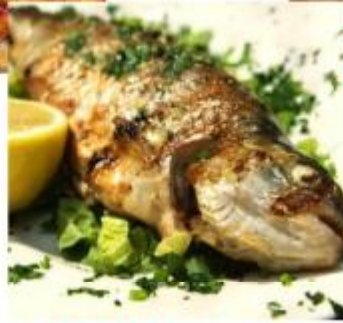
【奧地利湖區·鱒魚風味】