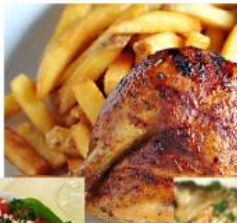
【莎麥堡酒館·香料烤雞風味】