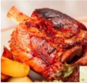
【克倫洛夫小鎮·香脆豬腳風味】