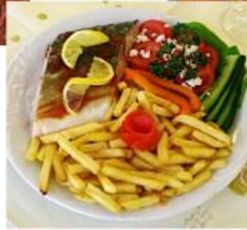
【捷克家常年菜·香煎鮮魚佐時蔬】