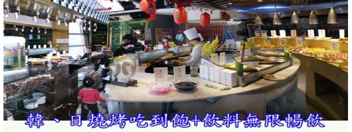
韓、日燒烤吃到飽+飲料無限暢飲

★★★★★特別安排在太原享用韓式及日式燒烤風味飲料啤酒無限暢飲,保證讓您直呼過癮★★★★★