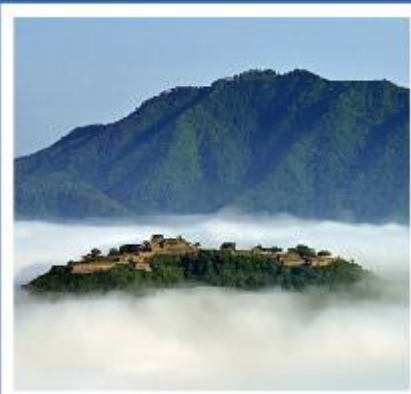
天空之城～竹田城跡