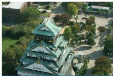
大阪城公園(不上天守閣)