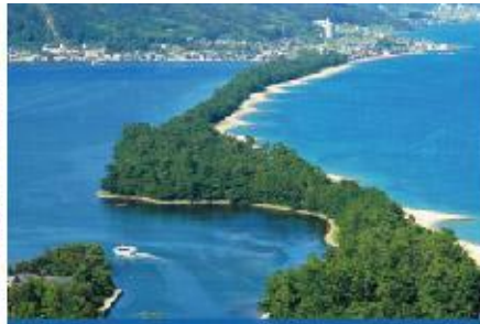
天橋立(上下搭乘纜車)