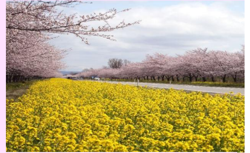
■秋田大瀨村~櫻花、油菜花之路

✿角館·武家屋敷~檜木內川堤~賞櫻花✿【櫻花季約4月中旬~5月上旬】 推薦日本賞櫻百選