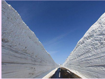
■>> 八甲田山雪之迴廊