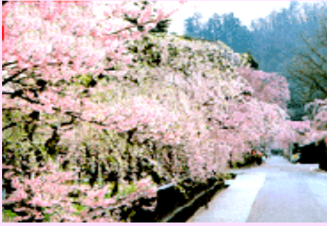
■角館~小京都櫻花風情