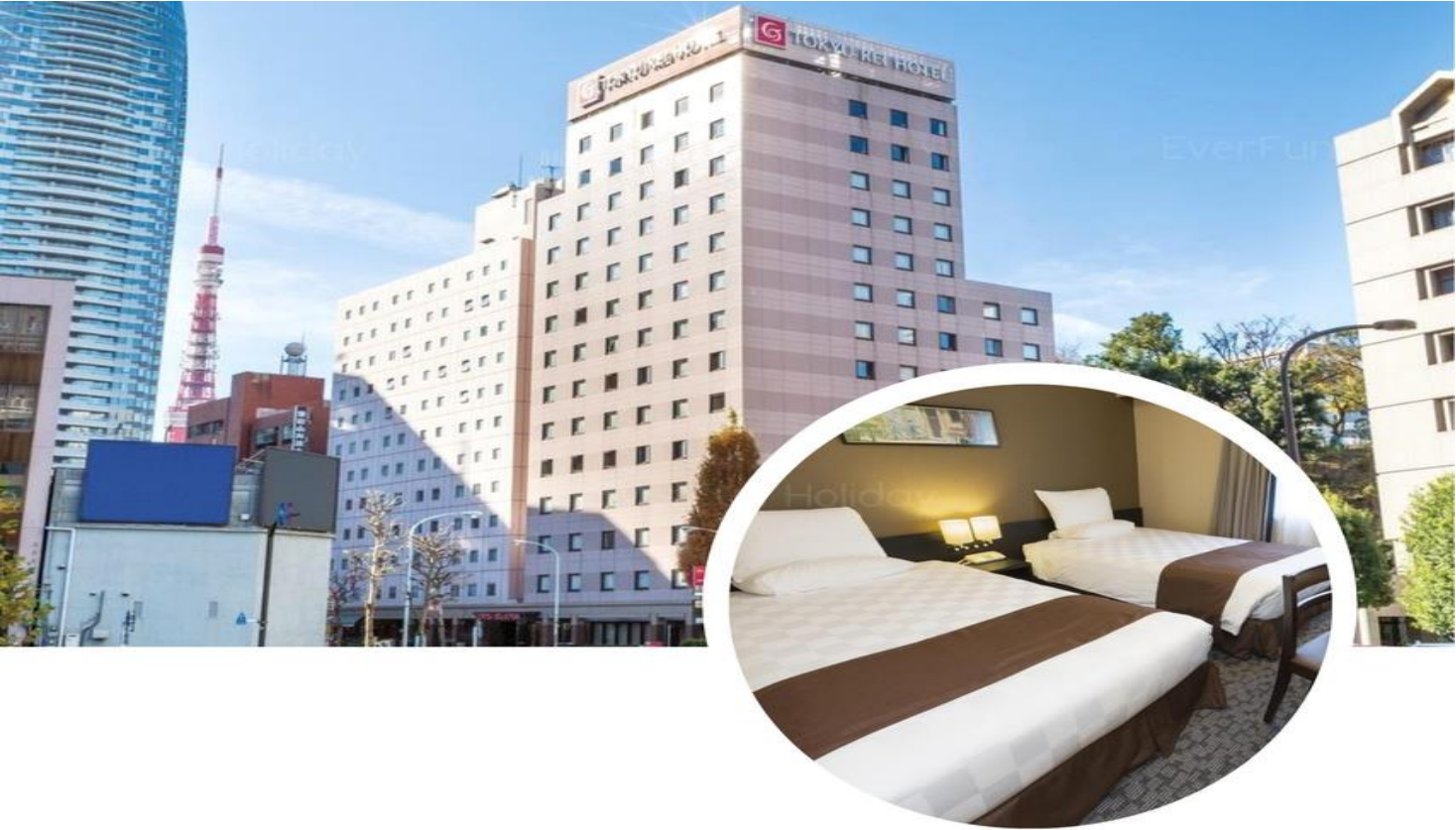
Shinbashi Atagoyama Tokyu REI Hotel 新橋愛宕山東京RIE