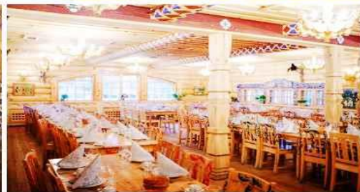
聖彼得堡：夏宮巴洛克風餐廳 Summer Palace

體驗純斯拉夫風格的宮廷饗宴，尊貴的服務加上道地的俄式料理，讓您彷彿親訪彼得大帝的午宴。