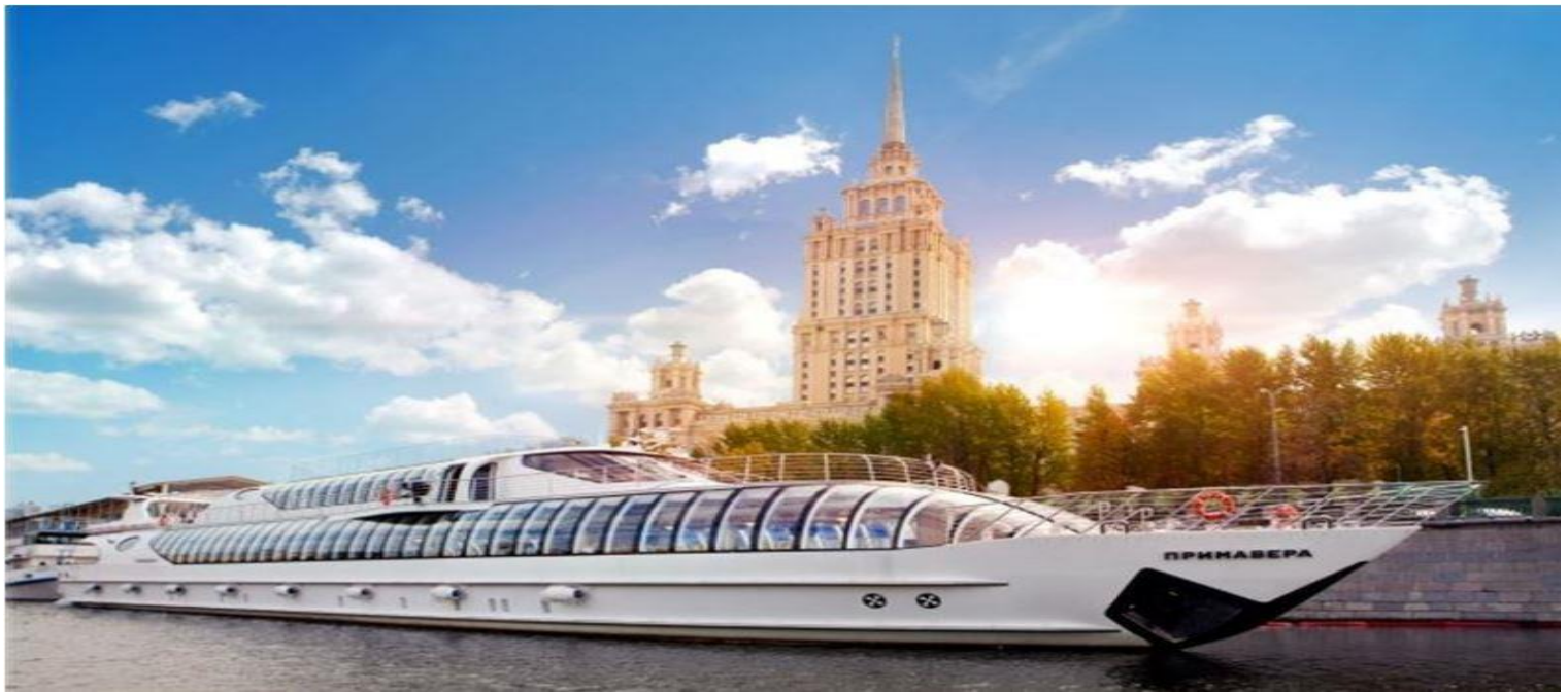
聖彼得堡：普丁總統生日餐廳

體驗純斯拉夫鄉村風格的饗宴，道地的俄式料理及北國風情的建築，讓您同享普丁總統用餐情境。