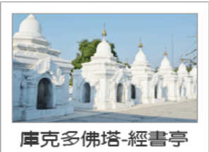
庫克多佛塔-經書亭

【庫克多佛塔 Kuthodaw Pagoda】 建於 1859 年，佛塔四周圍繞著 729 座白色的經書亭，每座亭內有一塊石碑，稱功德碑，每碑刻有佛經一章，每片石碑寬 3.5 英尺、高 5 英尺、厚 5 英尺。石碑上經文有除了緬文外還有古老的 PALI 文，是故連同庫克多佛塔在內總計有 730 座大小佛塔，此一巨大工程共耗時 5 年完成，也因此此座石碑經書院有【塔林】之稱。此為世界上最大的書，也是佛教文化的精華所在，更是佛教徒與東西方學者眼中佛教的瑰寶。據估計，這些經文若以 1 個人 1 天念 8 個小時來計，要 450 天（相當於一年零三個月）才能唸完全部的經文。據記載，第 5 次佛教大會時，Mindon 王請了 2400 位和尚，以接力的方式唸誦經文，共念了 6 個月才唸完。