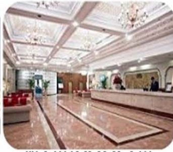
明亮寬敞的接待大廳