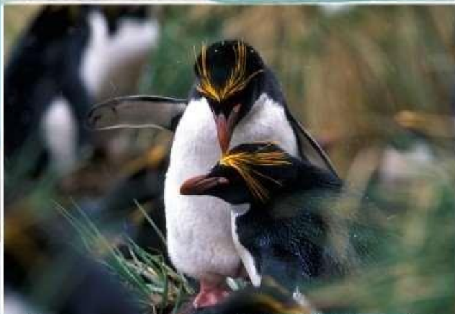
馬可羅尼企鵝 Macaroni penguin

(Antarctic Tern)，與不是天天可以看得到的灰背信天翁(Light-mantled Albatross)等等。看過海灘上成千上萬隻的國王企鵝(king penguins)的網路照片對吧？她們不在南極半島上，她們可是只有在南喬治亞群島上登岸繁殖活動的哦！若天氣情況許可，將儘可能安排近十次的陸地上觀察活動，因為南喬治亞島上就有一億隻以上的生物在此生存！每一次的登岸，皆是在熱鬧穿梭的動物之間搶灘！每天在不同的海岸，和國王企鵝等各種生物零距離、面對面對話（因而有人稱此地為：極地中的加拉巴哥）。看她們搖擺的可愛走路模樣，近身觀察其繁殖棲地的體驗實在令人難忘！