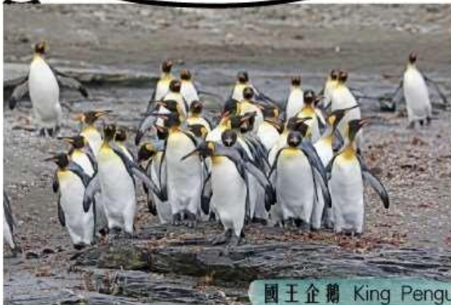
國王企鵝 King Penguin