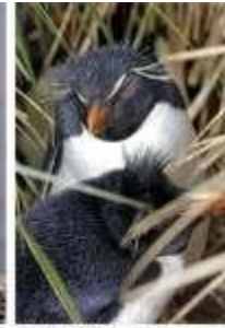
跳岩企鵝 Rockhopper Penguins