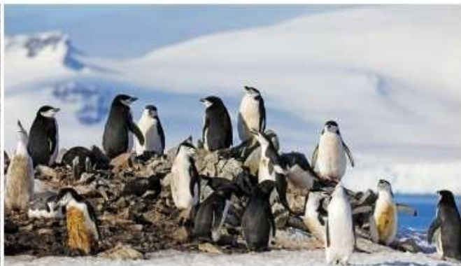
頰帶企鵝 Chinstrap Penguin