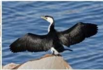
藍眼鸕鶿 King Cormorant