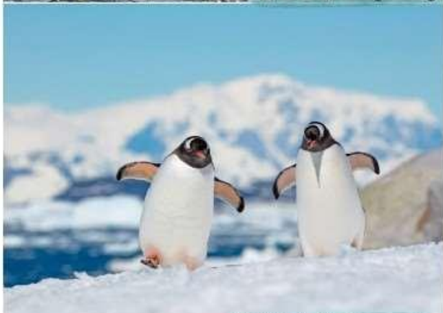
巴布亞企鵝 Gentoo Penguin