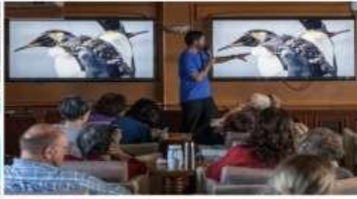
船上各種海洋生態、極地生活等豐富講座