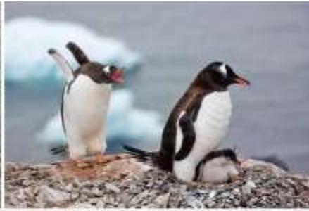
巴布亞企鵝 Gentoo Penguin