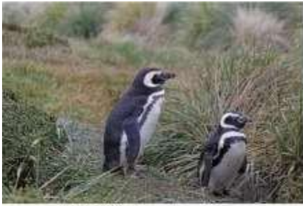
麥哲倫企鵝 Magellanic Penguin

除了健行觀察生態外，也可趁此機會在具有濃厚英式風情的首府－斯坦利港(Port Stanley)逛街購物、參觀博物館及福克蘭戰爭紀念館等人文景點，之後，再去郵局寄個明信片，輕鬆走走，也是要的啦！