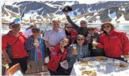
甲板享受美食美景