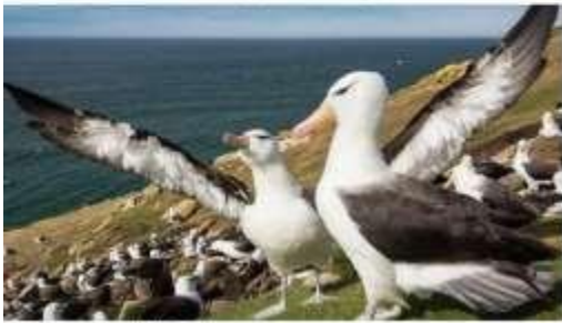
黑眉信天翁 Black-browed Albatross